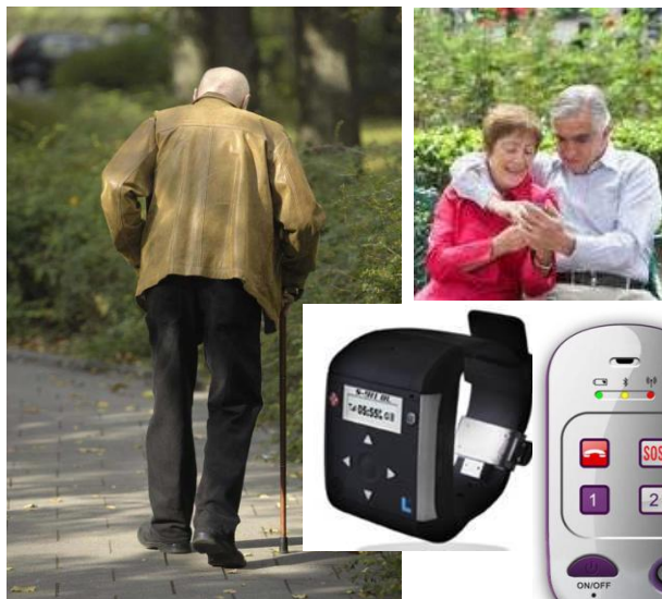
Terminal de localización