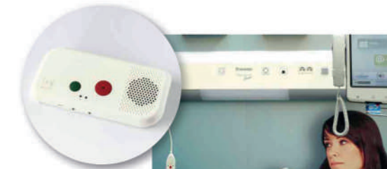
1 Comunicación directa paciente-enfermera.