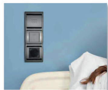
12 Soluciones eléctricas totalmente integradas.