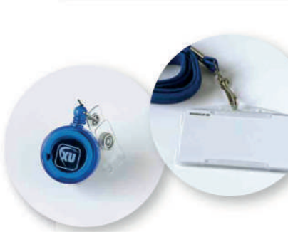
7 Identificación personalizada en la realización de tareas.