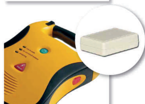
13 Control de ubicación de material, personal médico, etc.