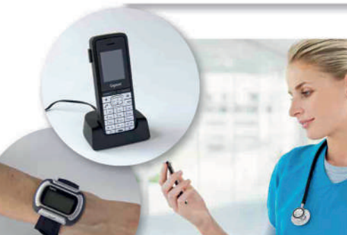
6 Mensajería instantánea inalámbrica y de pulsera.