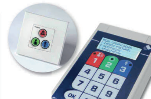
8 Atención codificada de tareas y alarmas de cada paciente.