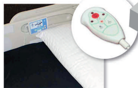
15 Automatismos para un mejor confort del paciente.