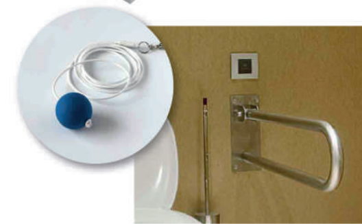
9 Tirador de baño para emergencias.