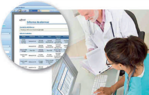
5 Puesto de control con pantalla táctil y consulta de informes.