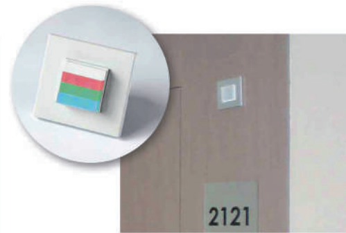
3 Alarma para pasillo con diferentes códigos de colores.