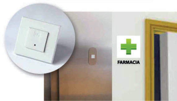
11 Control acceso zonas restringidas. Farmacia, quirófano, ascensores, etc.