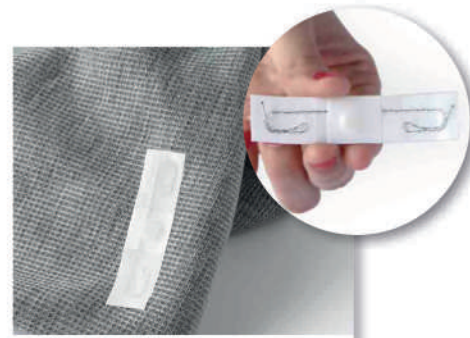
16 Identificación automática rápida y correcta de prendas.

Nuestras soluciones geriátricas se adaptan a la dimensión y características de cualquier centro hospitalario, residencias, centros de día... incorporando de forma escalable aquellos módulos y dispositivos que su centro necesite.