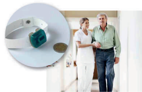
10 Control de fugas en pacientes mediante un pequeño tag.