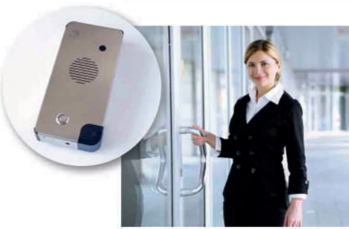
4 Comunicación con visitas exteriores y lector RFID.